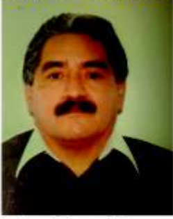
Por Gustavo Gómez Pasco