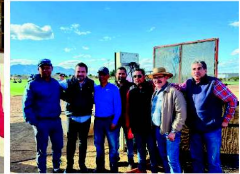
Cananea, 9 de Marzo.