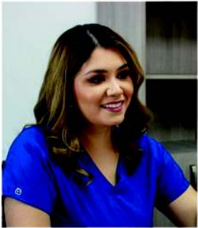
By Dr. Lilia Orduño Peña (Doctor Li)