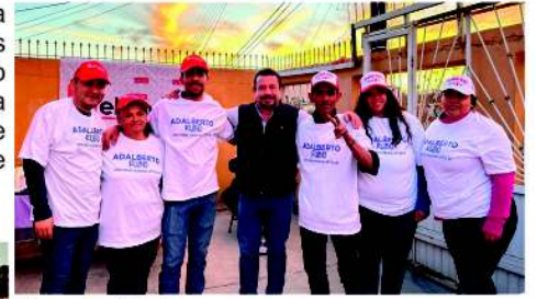
Nogales 13 de marzo