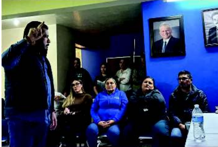
Imuris, 14 de Marzo.