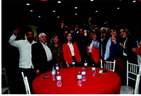
Magdalena de Kino, 16 de Marzo.