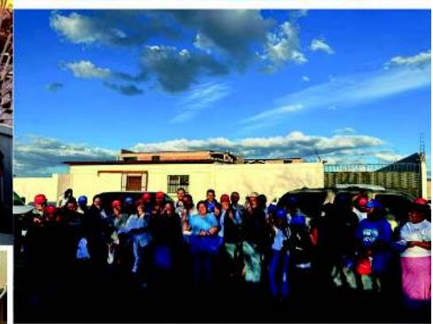
Agua Prieta 14 de marzo