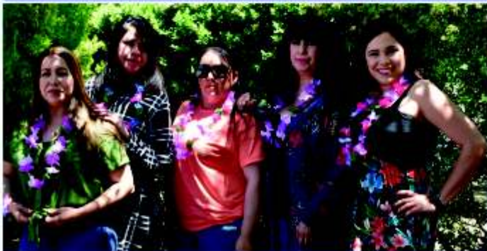
Chicas de Control de Calidad