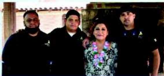
Personal de Cafeteria Veronica's