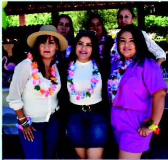
Chicas PTZ tercer turno