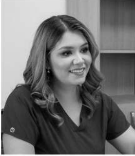
By Dr. Lilia Orduño Peña (Doctor Li)

In the midst of controversies, hope, advances in medical knowledge and human nature itself, the issue of in vitro fertilization has become much more present in recent years.