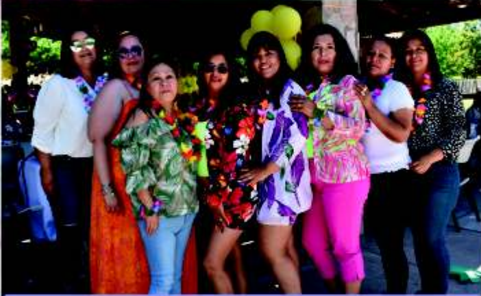
Chicas del primer turno