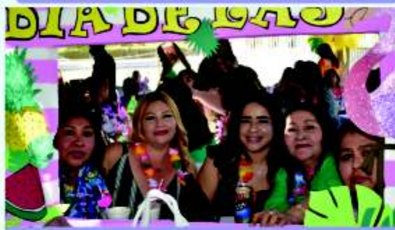
Chicas del segundo turno