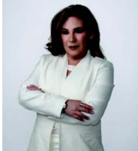
Por Mtra. Alma Rivera

compran por necesidades y/o motivaciones, por lo que no debes mezclar lo que el cliente quiere comprar, lo que el cliente necesita, lo que quieres vender y lo que tu comprarías, ya que el fin de la venta es satisfacer al cliente o nuestros intereses y si no concretas una venta y es porque como empresa no podemos cumplir, no nos engañemos calificándole como Cliente Difícil, debemos reconocer que tenemos áreas de oportunidad como empresa.