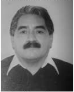
Por Gustavo Gómez Pasco