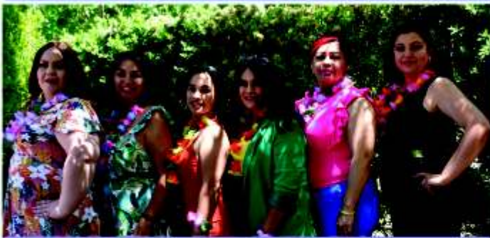
Chicas del segundo turno